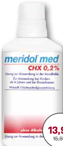
meridol® med CHX 0,2% Lösung 300 ml 1 l = € 46,60