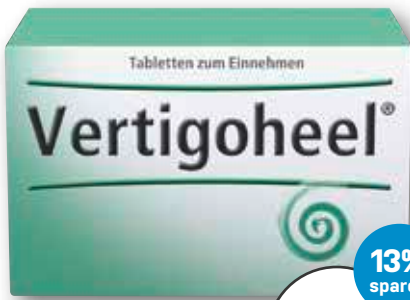
Vertigoheel® 100 Tabletten