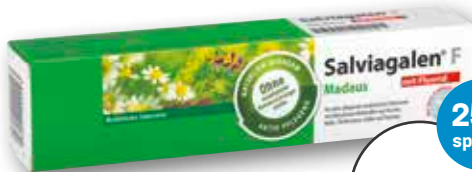
Salviagalen® F Madaus Zahncreme mit Fluorid, 75 ml 1 l = € 46,40