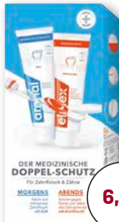
aronal® / elmex® Doppelschutz- zahnpaste 2 x 75 ml 1 l = € 46,53