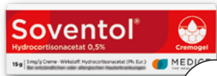
Soventol® Hydrocortisonacetat 0,5% 15 g 1 kg = € 598,67