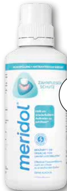
meridol® Mundspülung 400 ml 1 l = € 17,45