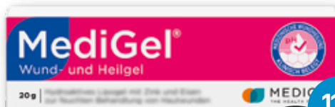
MediGel® Wund- und Heilgel 20 g 1 kg = € 349,00