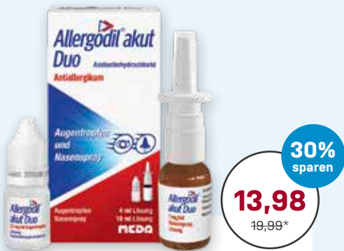
Allergodil® akut Duo 4 ml AT akut/10 ml NS akut 1 Kombipackung