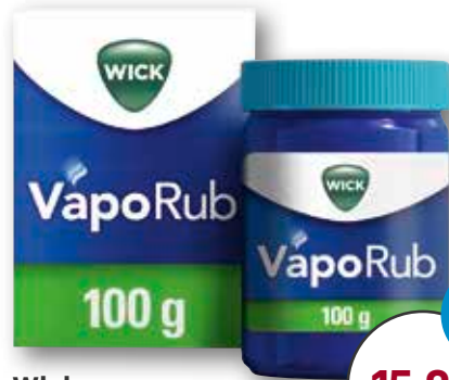
Wick VapoRub Erkältungssalbe 100 g 1 kg = € 159,80